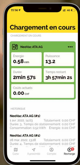
« NeoVac myCharge » dans le détail : neovac.ch/mycharge

Offrez à vos clients et clientes et aux habitants la possibilité d'activer, de stopper et de payer les recharges sur votre réseau directement via un smartphone. « NeoVac myCharge » leur permet de trouver pour leurs véhicules électriques des bornes de recharge publiques reliées au réseau partenaire ou NeoVac ou des réseaux privés également compatibles.