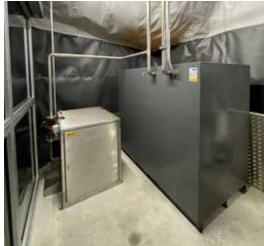
Il serbatoio intermedio si trova a 3000 m.s.l. m.