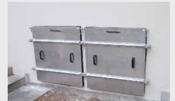
Paratia per finestre con piastra di bloccaggio