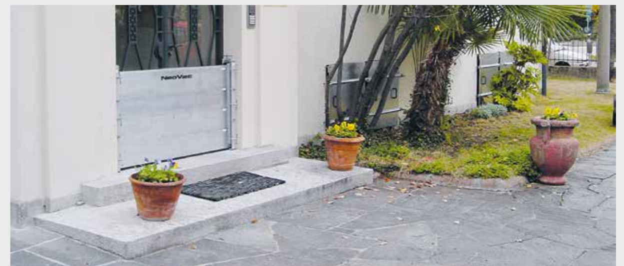
Montaggio alla porta