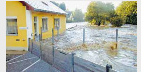
Le strade vengono protette in modo affidabile.

Per proteggere passi carrai degli edifici, parcheggi sotterranei, accessi a terreni è stata messa a punto una serranda contro le piene a controllo elettropneumatico. La barriera di contenimento consente una capacità di carico estremamente elevata.